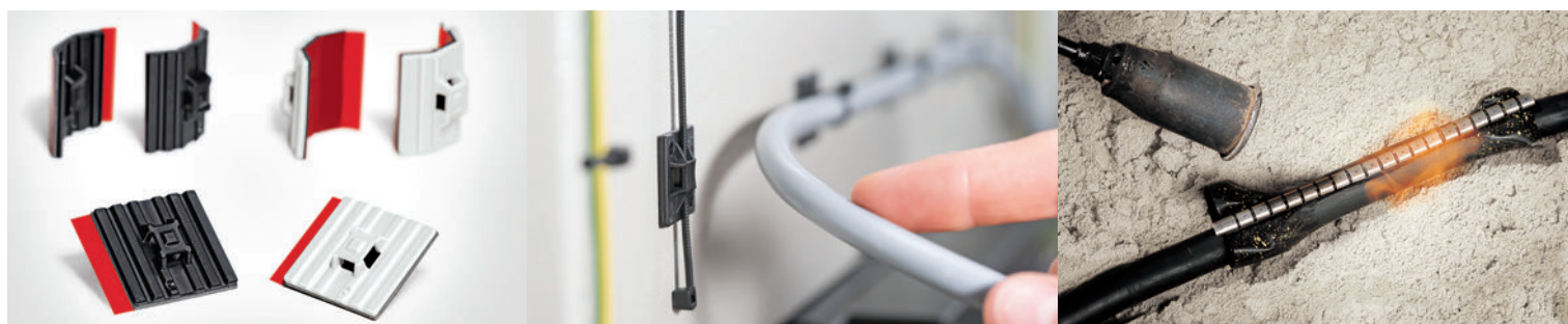
A sinistra: il supporto FlexTack. Al centro: SolidTack - e a destra: il kit di riparazione per cavi RMS.