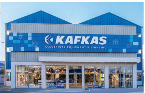
A Ottobre i dipendenti e i clienti hanno potuto approfittare dei vantaggi della "Settimana nazionale del servizio clienti" nei (quasi) 60 punti vendita FEGIME Hellas & Cyprus che sono tutti molto moderni e accoglienti.