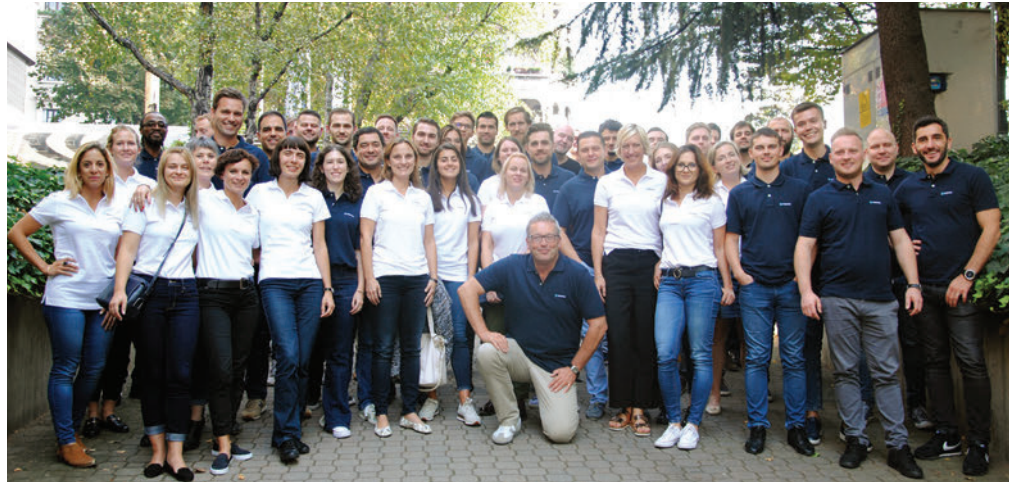
FEGIME Future: i nostri imprenditori della prossima generazione sono sempre più connessi.