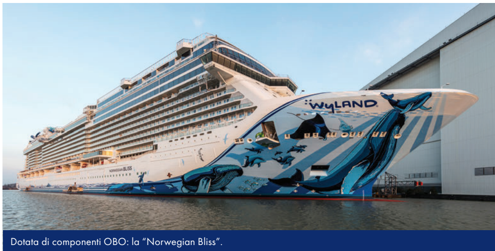
Dotata di componenti OBO: la "Norwegian Bliss".

OBO Bettermann è un leader del mercato nel settore del supporto cavi. Che si tratti di acciaio inossidabile o alluminio, zincato o zincato per immersione a caldo, i materiali e le superfici di alta qualità OBO nonché le finiture ottimali