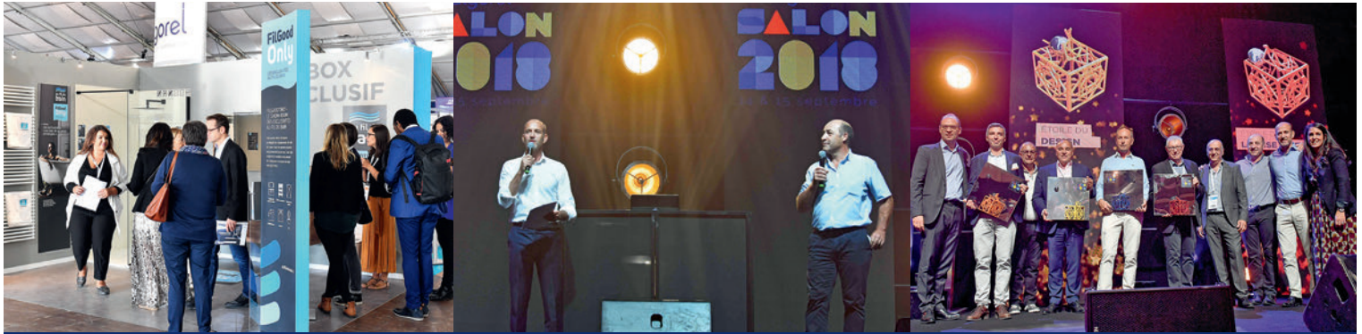
La cerimonia di premiazione per l' "Étoiles Algorel" (a destra) è stato un momento eccezionale del grande evento fieristico, a cui partecipavano 195 espositori.